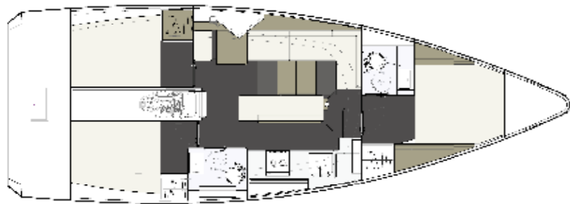
VERSION 214 3 CABINES, 2 SALLES D'EAU 3 CABINS, 2 HEADS