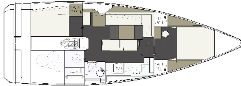
VERSION 111 2 CABINES, 1 SALLE D'EAU ARRIÈRE, 1 WC SÉPARÉ 2 CABINS, 1 AFT HEAD, 1 SEPARATE TOILET