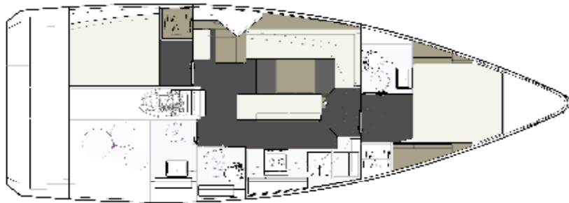
VERSION 114 2 CABINES, 2 SALLES D'EAU, 1 WC SÉPARÉ 2 CABINS, 2 HEADS, 1 SEPARATE TOILET